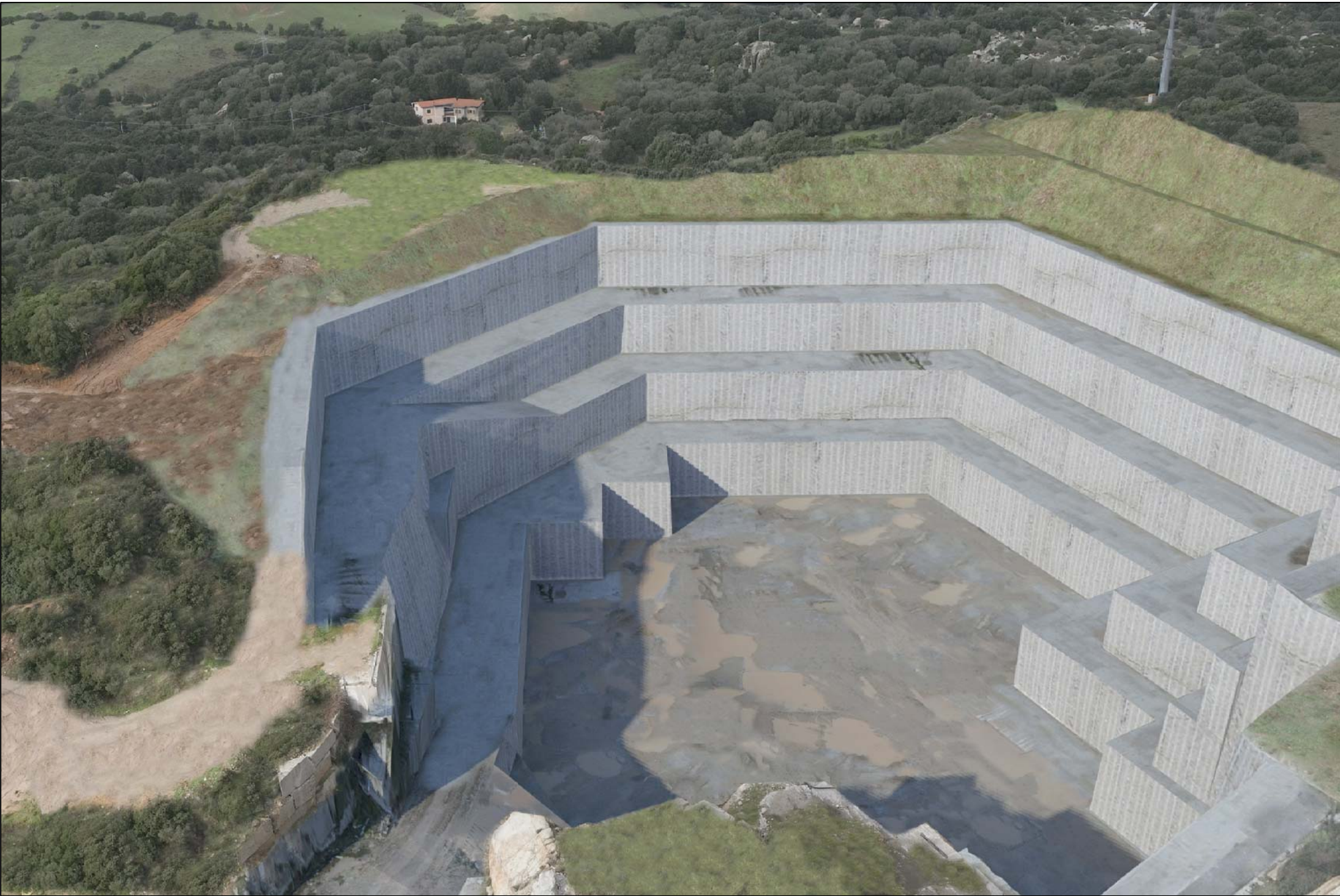
SITUAZIONE ALLO STATO FINALE