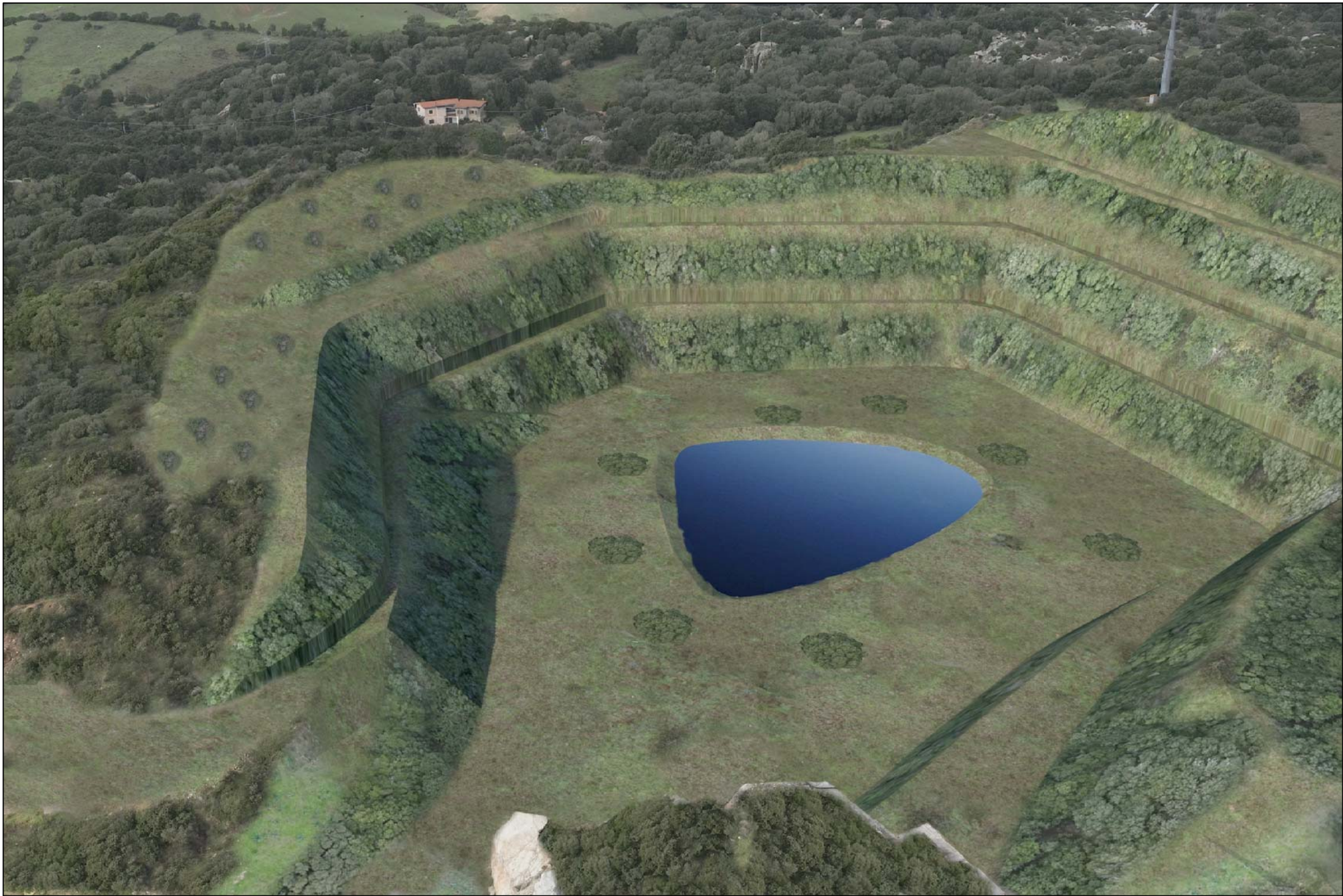
SITUAZIONE A RIPRISTINO AVVENUTO