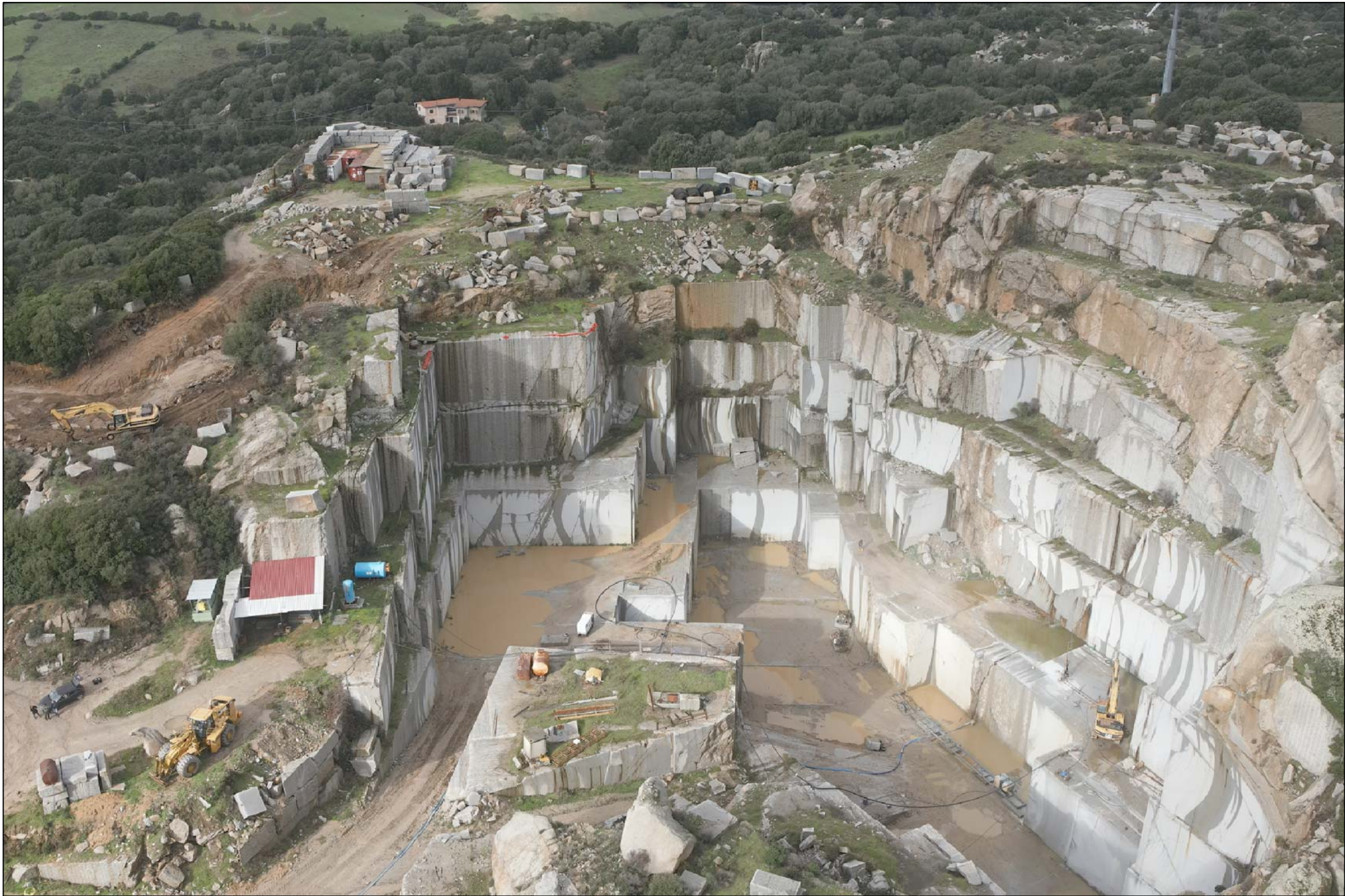
SITUAZIONE ALLO STATO ATTUALE